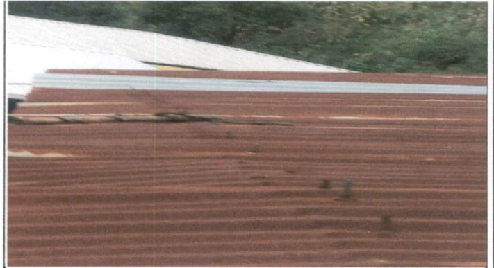
Foto 2: Sustitución de lámina, por lámina troquelada aluzinc calibre 26